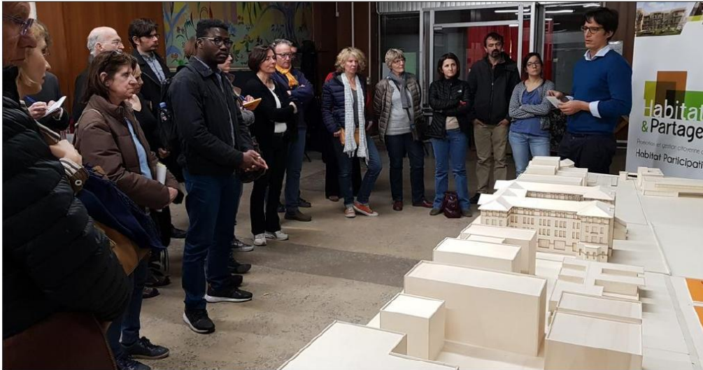
Une quarantaine de personnes se sont montrées intéressées par ce projet. Elles étaient présentes à la première réunion, fin mars, à Villeurbanne.