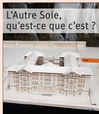
Le projet immobilier de l'Autre Soie s'étend sur 23 500m 2 .

Deuxième réunion de lancement du projet d'habitat participatif mardi 2 avril, à 20 heures, à l'Autre Soie, 24, rue Alfred-de-Musset, à Villeurbanne.