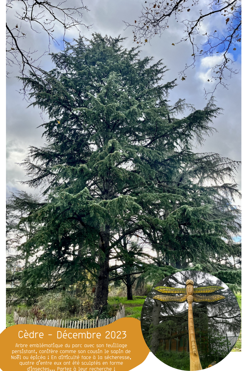
Cèdre - Décembre 2023 Arbre emblématique du parc avec son feuillage persistant, conifère comme son cousin le sapin de Noël ou épicéa ! En difficulté face à la sécheresse, quatre d'entre eux ont été sculptés en forme d'insectes... Partez à leur recherche !